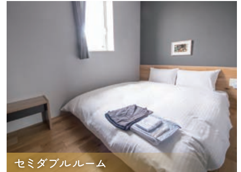
セミダブルルーム