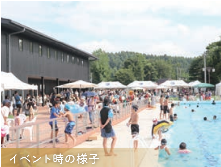
イベント時の様子