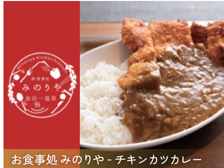
お食事処みのりや - チキンカツカレー