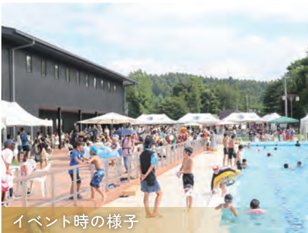
イベント時の様子