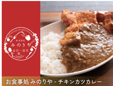
お食事処みのりや - チキンカツカレー